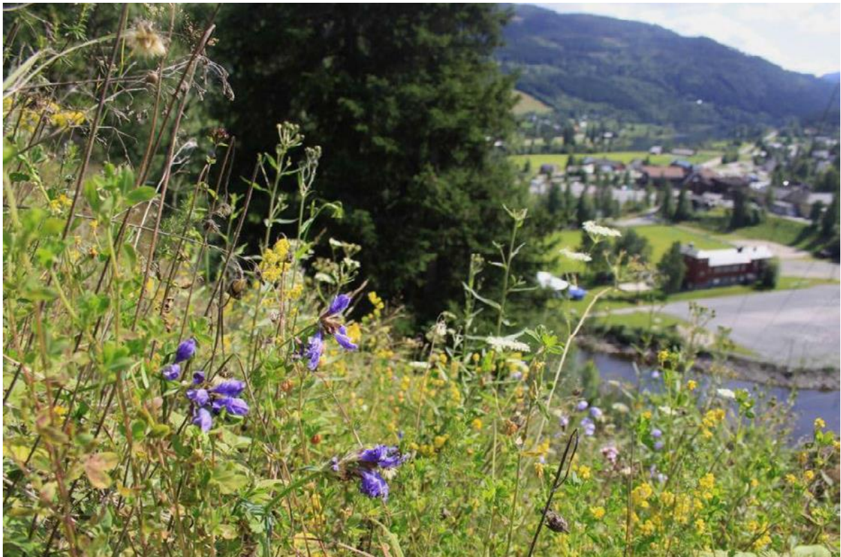
Dragehode på Spangerudberget med Bagn sentrum i bakgrunn.