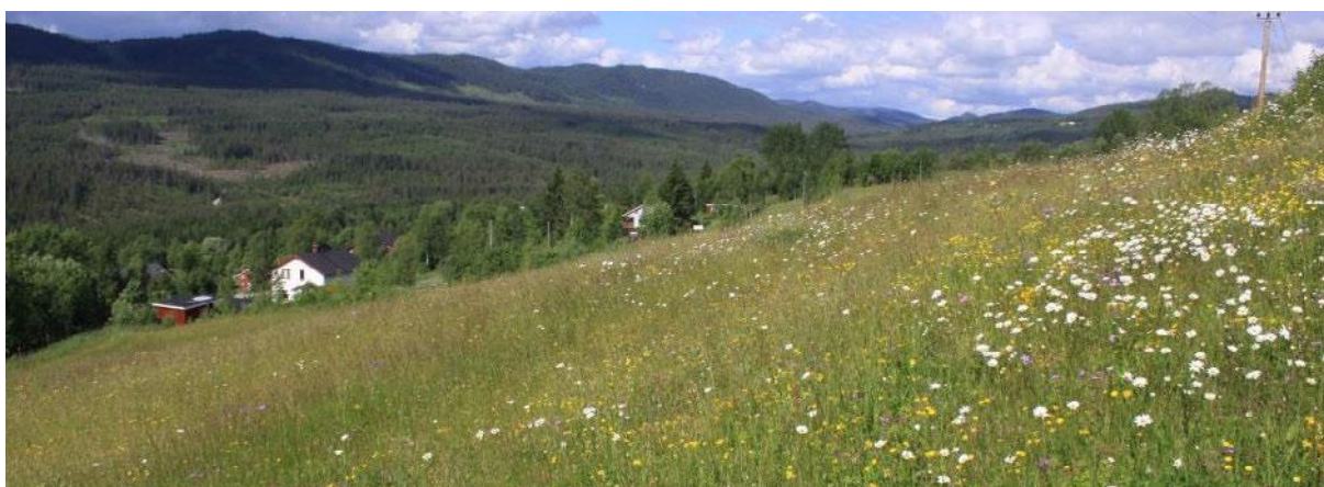
Bakkom i Hedalen, slåttemark med god hevd.

Regionale miljøvirkemidler forvaltes av Fylkeskommunen gjennom Regionalt Miljøprogram (RMP), som er vedtatt for perioden 2019-2022. Kommunale miljøvirkemidler forvaltes gjennom Spesielle miljøtilskudd i jordbruket (SMIL). Nye retningslinjer for Sør-Aurdal kommune skal gjelde for perioden 2020-2023, og skal vedtas politisk innen 31.01.2020. Lokale retningslinjene er sendt på høring til lokale faglag og Fylkeskommunen.